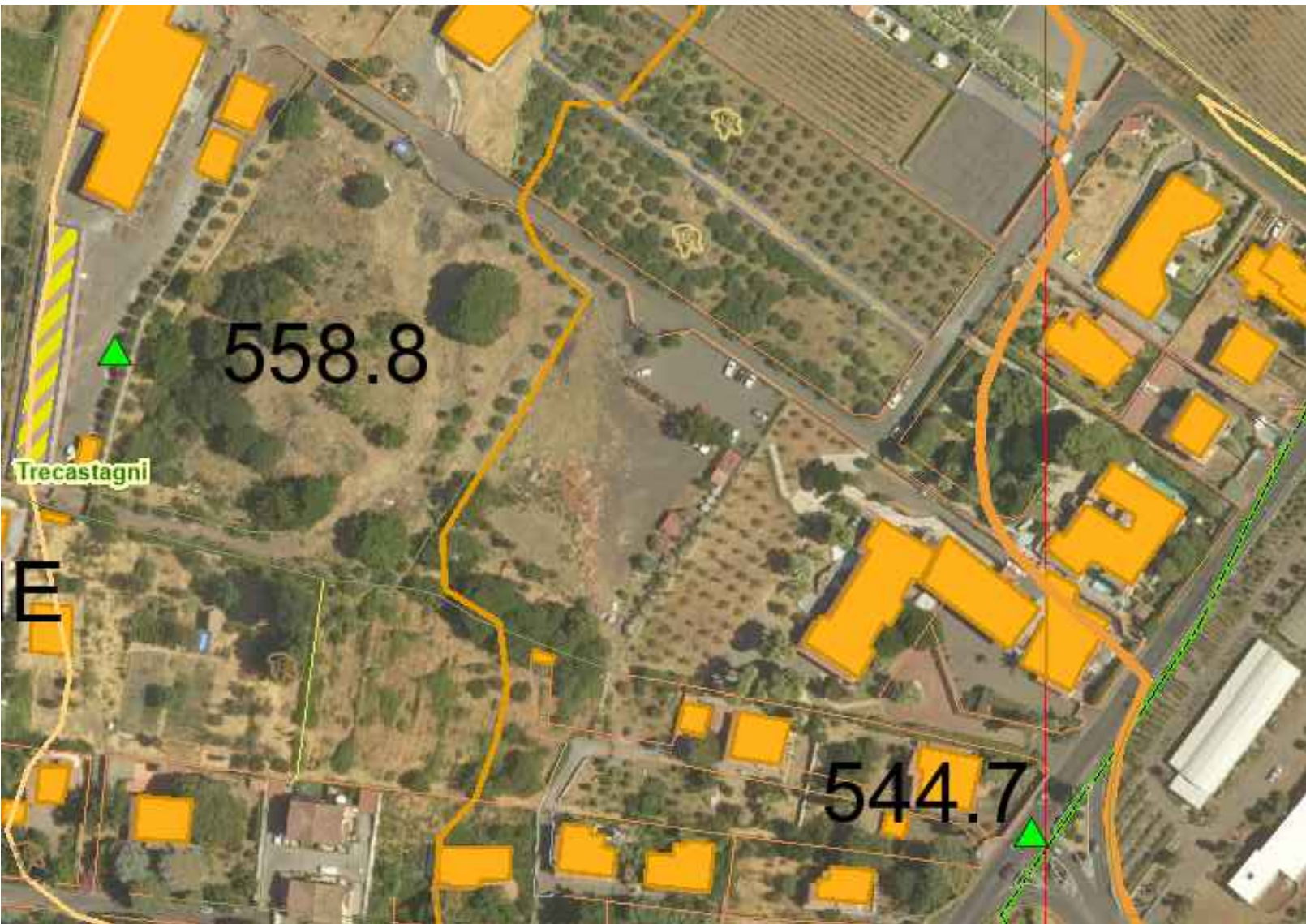
STRALCIO DI FATTO - CARTA TECNICA REGIONALE