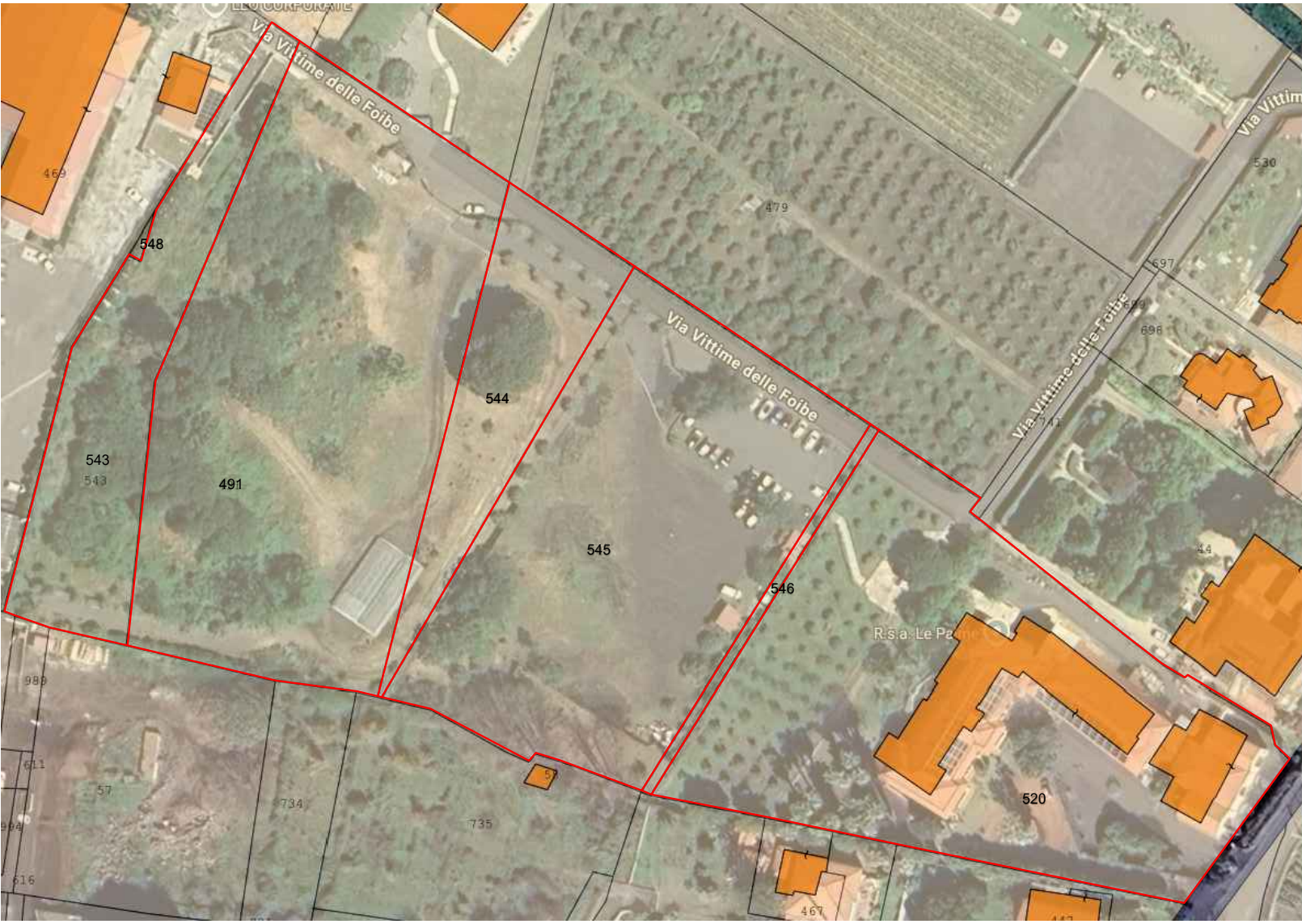
STRALCIO FOGLIO 14 - PARTICELLE 543,491,544,545,546,520.