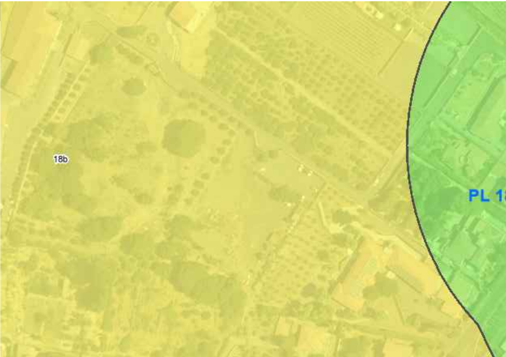
STRALCIO PIANO PAESAGGISTICO - LIV. TUTELA 1